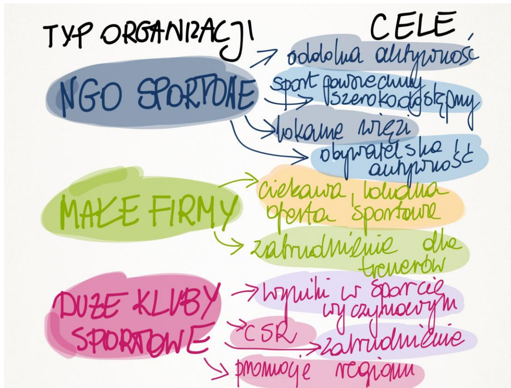
Rys 3. Cele poszczególnych aktorów ważnych dla oferty sportowej

Ważne! Nasze badanie przybliży perspektywę obywateli: ich percepcji oferty sportowej i lokalnej infrastruktury. Może się okazać, że mimo bogatej oferty lokalny sport jest z jakiś przyczyn niedostrzegany przez obywateli. Na tym etapie badania skupimy się na perspektywie ogólnopolskiej, ale wskazówką dla konsekwentnego rozwoju diagnozy sytuacji sportu powszechnego będzie powtarzanie badań lokalnie, na poziomie gmin, powiatów lub województw.