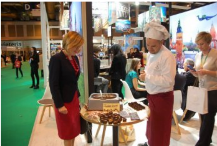
Międzynarodowe Targi Turystyczne FITUR w Madrycie