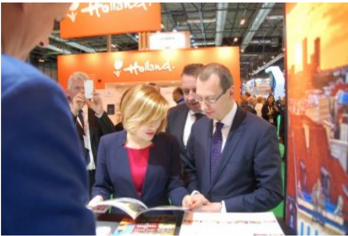
Międzynarodowe Targi Turystyczne FITUR w Madrycie