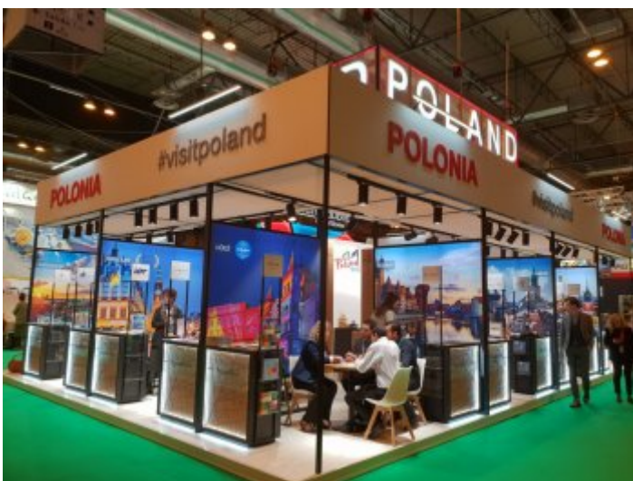
Międzynarodowe Targi Turystyczne FITUR w Madrycie

Ponadto w trakcie targów Pani Minister spotkała się z ministrami turystyki Hiszpanii, Bułgarii, Grecji, Kostaryki, Meksyku, Palestyny, Serbii oraz ambasadorami Bułgarii, Grecji, Kostaryki, a także wieloma przedstawicielami organizacji hiszpańskiego sektora turystyki.