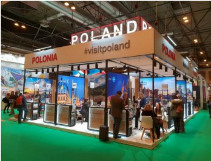
Międzynarodowe Targi Turystyczne FITUR w Madrycie